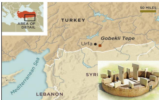
Рис. 1. Розташування Гебеклі-Тепе на Близькому Сході і структура Кільцевої мегалітичної арени (КМА)

Але «найбільшим негативом» є той незаперечний факт, що не тільки українські археологи ігнорують наслідки розкопок в Східній Туреччині рукотворного горба Гебеклі-Тепе з багатьма рештками дуже складних й утричі старших від пірамід у Гізі «Кільцевих мегалітичних арен (КМА)», що вказані на рис. 1, а й зарубіжні науковці не хочуть «забути» стару єгипетсько-месопотамську історію й погодитись з тим, що наші генетичні пращури 13 500 років тому започаткували у Гебеклі-Тепе першу на планеті пенеппленну цивілізацію, здійснили перехід від канібалізму до гуманізму і для його утвердження винайшли продуктивне сільське господарство.