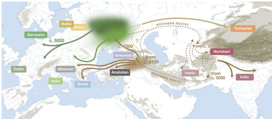
Рис. 2. Рух індоєвропейських мов з «вірменської колиски»

Побудуємо текст тез на аналізі висновків важливої статті великого колективу авторів з багатьох країн, що має назву «Дерева мов із вибіркою предків підтримують гібридну модель походження індоєвропейських мов» [1]. Її поява була наслідком поєднання зусиль понад 80 фахівців-лінгвістів для створення й нового аналізу базової лексики зі 161 індоєвропейської мови, включаючи 52 давні або історичні мови. Головним результатом можна вважати карту-схему на рис. 2 з позначками для пояснення просторового поширення індоєвропейських мов.